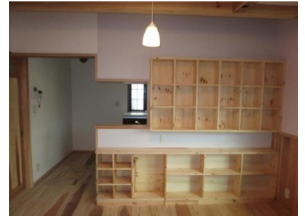
飾りものが楽しみで、LDの棚の造りには拘りも・