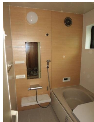
浴室(UBサーモバス) 壁は瀬戸漆喰仕上