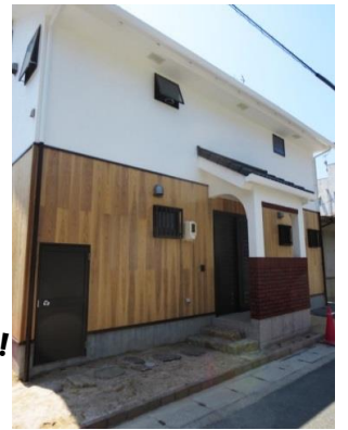
アプローチは、本物の飛び石、石段