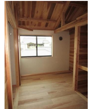
2階寝室(白壁は瀬戸漆喰)