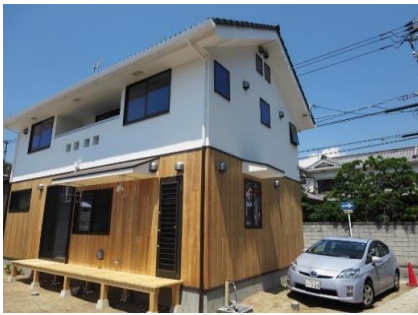
2階は瀬戸漆喰、1階杉板t=30素地