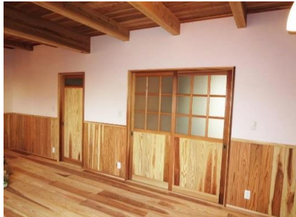
リビングダイニングの北面、オーダー建具

板倉工法と瀬戸漆喰の安心・安堵のコラボ 杉板の“質”には拘ったが、無節の多さは格別 予算と可能性の挑戦・分離発注だからこそ適った！