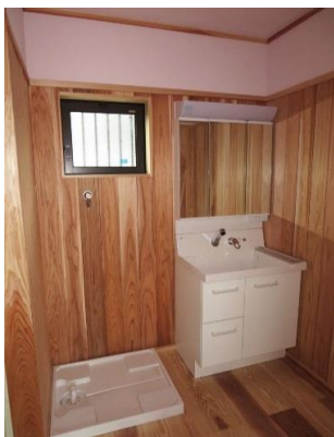
洗面脱衣(3面鏡) 壁は杉板 t 15無節羽目板)