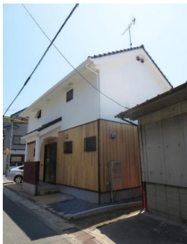
街に入ってくると見えてくる姿