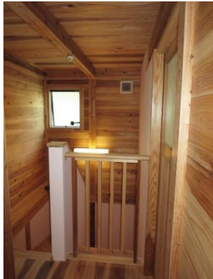
階段室の多くも無垢の杉の空間