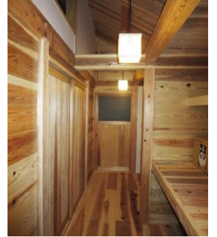
廊下もほとんど無垢の杉板空間

街中のメイン通りに面した北玄関 杉の外壁板の素地を少しでも楽しみたいという想い！