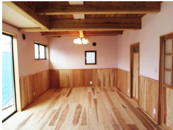
心の安らく、自然の空間でありたかったリビング・ダイニング