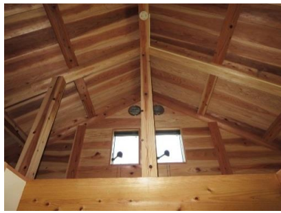
2階天井は杉板t=30素地(無節)