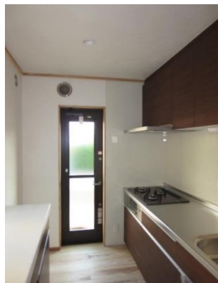
ダイニング(2400ステン) 壁は瀬戸漆喰仕上